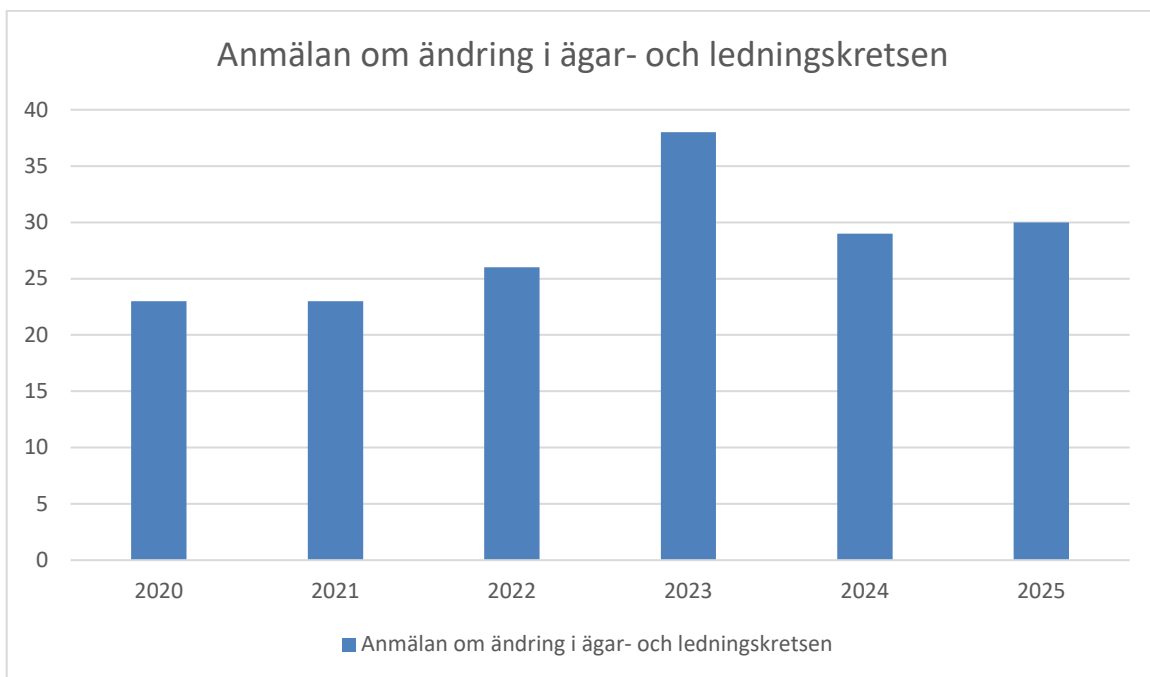
Bild 5. Tabellen visar antal ärenden som avser anmälan om ändring i ägar- och ledningskretsen under åren 2020 – 2025