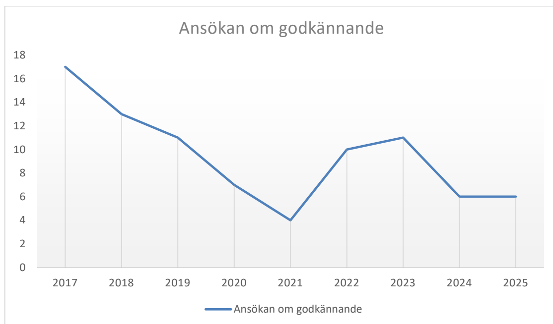
Bild 4. Antal ärenden om godkännande mellan 2017-2025. Ärendena innefattar även utökning och förlängning av utökning av antal platser, ansökan om undantag från öppenhetsprincipen m.m.

Förskoleförvaltningen gör i samband med att en ny verksamhet startar eller att en verksamhet byter lokaler en inledande tillsyn. Denna tillsyn är en viktig kontroll av att det som huvudmannen presenterat i sin ansökan även förverkligas. Tillsynen innebär ett verksamhetsbesök och dokumentstudier. Under år 2025 har två inledande tillsyner slutförts, motsvarande de ansökningar som inkommit och godkänts av förskolenämnden. Bägge ärendena avser enskilda huvudmän som tagit nya lokaler i bruk. Dessa huvudmän har sedan tidigare även bedrivit fristående förskola i Malmö. I båda de inledande tillsynerna som förskoleförvaltningen genomfört under år 2025 har förskolenämnden på delegation avslutat ärendena utan sanktioner.